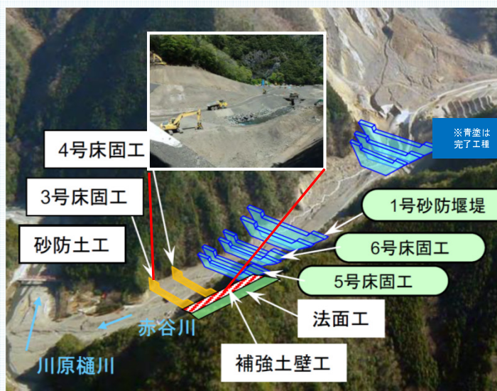
川原樋川床固工群(五條市赤谷 平成29年4月)