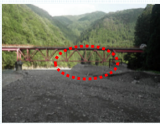
上流域から流出し堆積した土砂 (河床上昇・橋梁クリアランス減少)