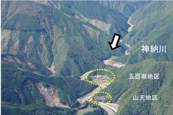
神納川流域(十津川村)